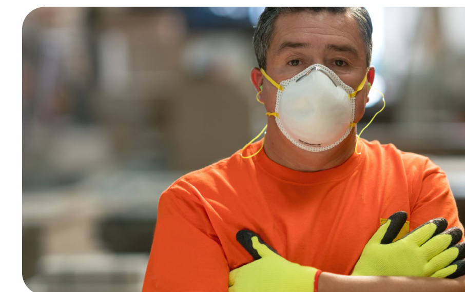
Programa de Proteção Respiratória (PPR)

Laudos e relatórios técnicos, exames clínicos, exames complementares e consultorias para redução de riscos e orientação das normas regulamentadoras.