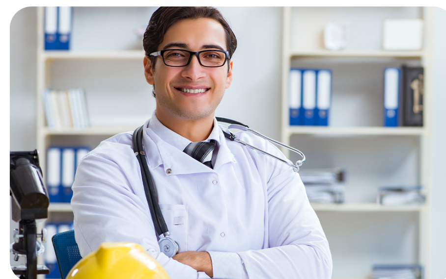
Programa de Controle Médico de Saúde Ocupacional (PCMSO)