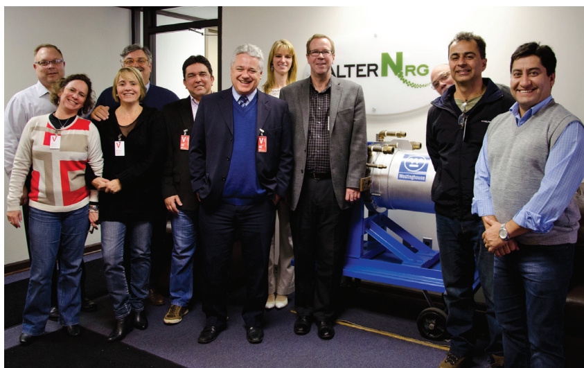
Visita ao Research Center da Westinghouse Plasma Corp