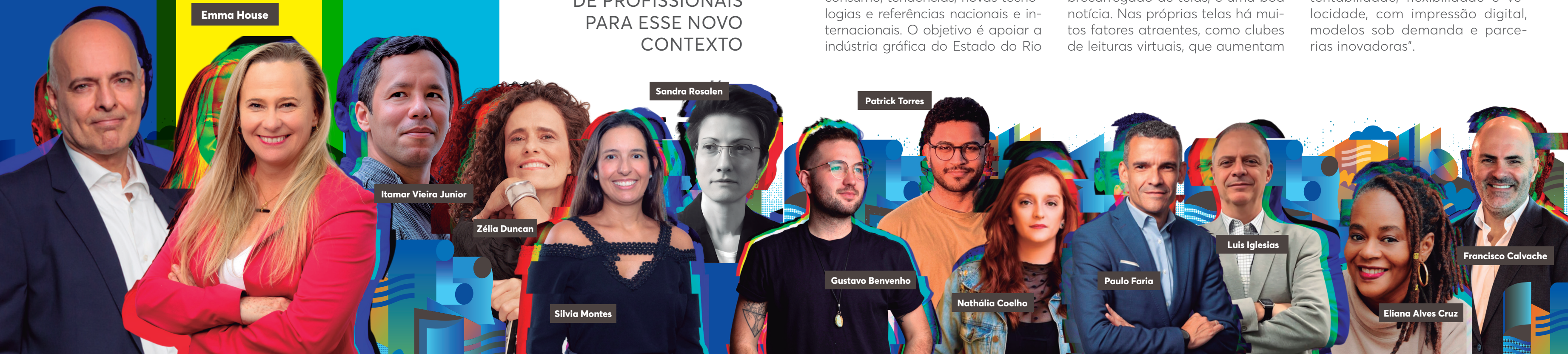
Itamar Vieira Junior