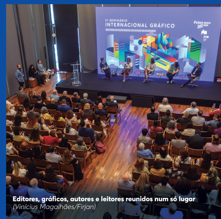
Editores, gráficos, autores e leitores reunidos num só lugar