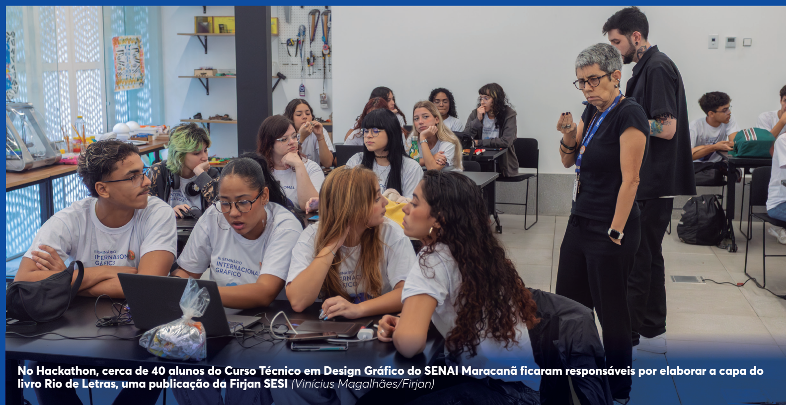
No Hackathon, cerca de 40 alunos do Curso Técnico em Design Gráfico do SENAI Maracanã ficaram responsáveis por elaborar a capa do livro Rio de Letras, uma publicação da Firjan Sesi