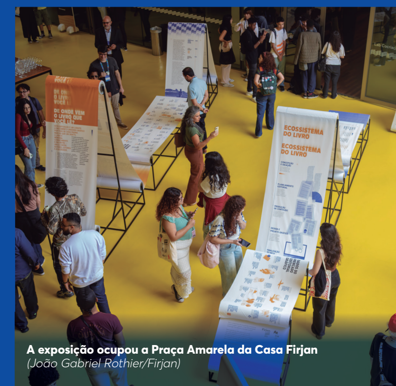
A exposição ocupou a Praça Amarela da Casa Firjan