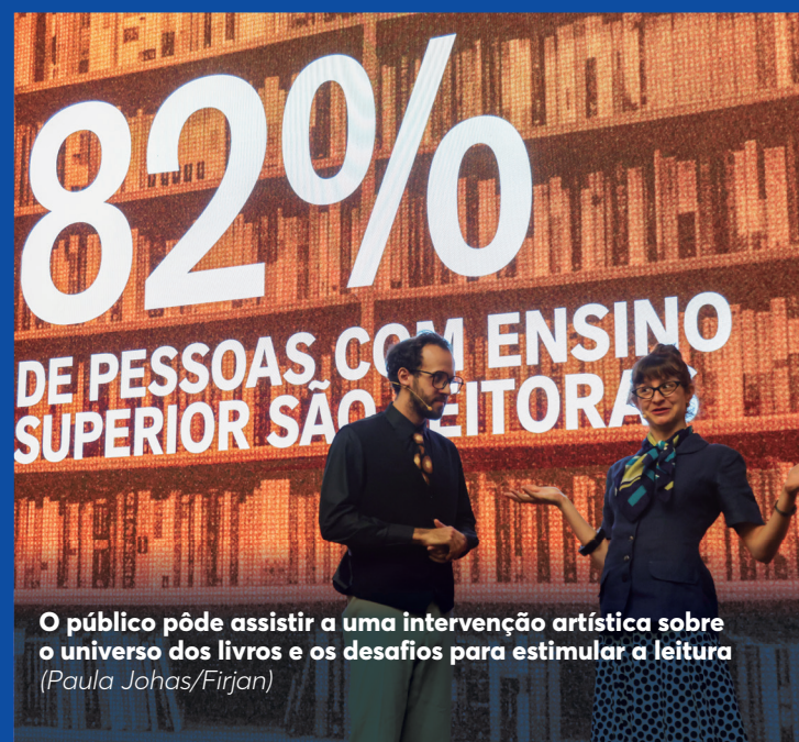
O público pôde assistir a uma intervenção artística sobre o universo dos livros e os desafios para estimular a leitura