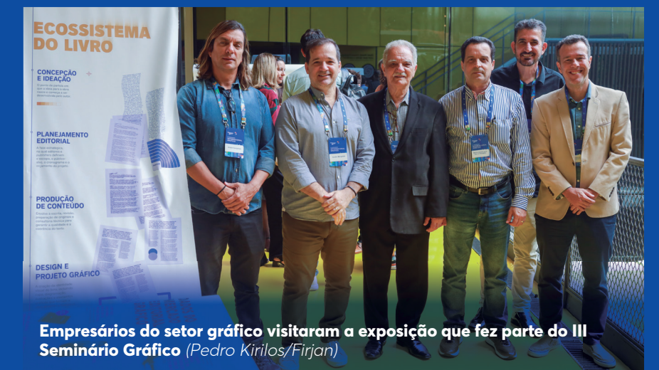
Empresários do setor gráfico visitaram a exposição que fez parte do III Seminário Gráfico