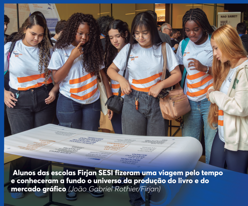
Alunos das escolas Firjan Sesi fizeram uma viagem pelo tempo e conheceram a fundo o universo da produção do livro e do mercado gráfico